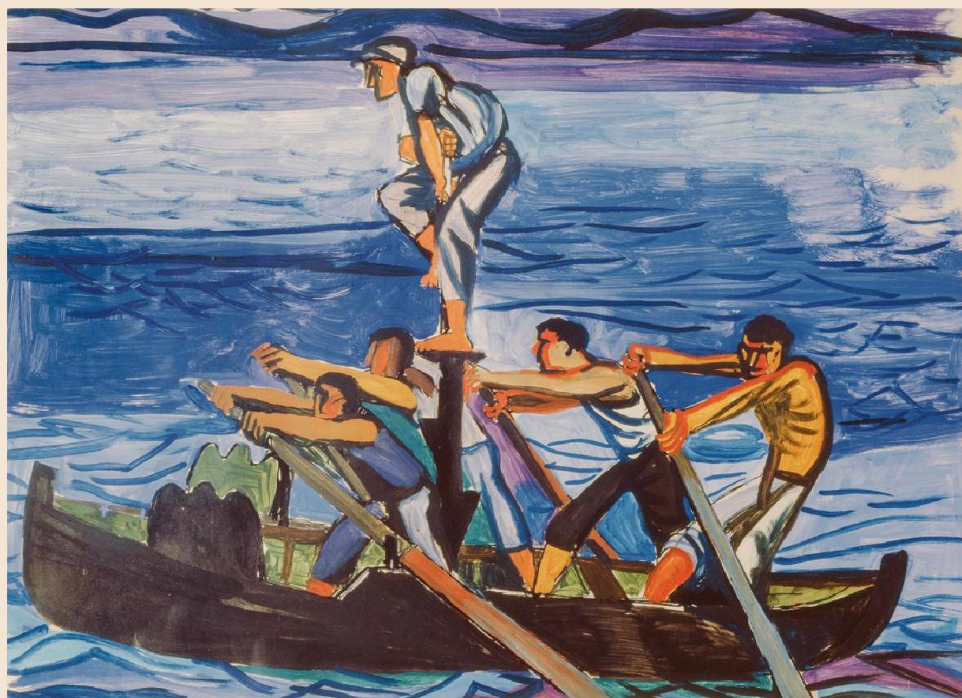
A pesca. Renato Guttuso, «Scilla», 1949. Il dipinto è esposto nella mostra all'M9 di Mestre dedicata a Sandro Pertini. Il dipinto fa parte della collezione privata del Presidente, poi donata ai Musei Civici di Savona