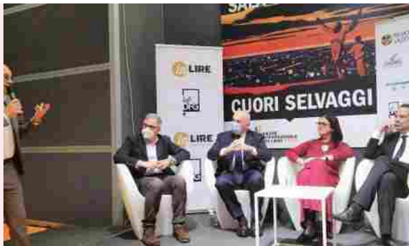
I giurati con l'editore al Salone Internazionale del Libro di Torino

I 5 PREMI – Il Premio Invictus prevede cinque riconoscimenti: Premio Invictus città' Cisterna di Latina (5.000 euro per il primo classificato), Premio Grandi Lettori Log Up Service e STI srl (1.500 euro per il secondo e il terzo), e due menzioni speciali, Premio Guerin Sportivo (500 euro per il quarto) e Premio Lab DFG (500 euro per il quinto).