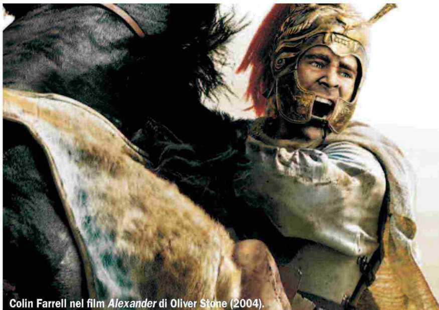
Colin Farrell nel film Alexander di Oliver Stone (2004).

Di sicuro noi sappiamo che Alessandro spirò nella notte fra l'11 e il 12 giugno del 323 a.C., come ci è testimoniato inoppugnabilmente da alcuni documenti cronografici babilonesi. Per il resto, le testimonianze più antiche sulla morte di Alessandro si dividono in due gruppi: autori che dichiarano di seguire il racconto delle Efemeridi (una specie di resoconto giornaliero della spedizione, redatto, su ordine di Alessandro, dal suo segretario Eumene di Cardia), come Plutarco e Arriano; e autori che non lo seguono (Diodoro, Giustino e Curzio Rufo). Elementi comuni alle due tradizioni sono solo la partecipazione di Alessandro a un banchetto organizzato da Medio di Larissa, e lo stato patologico in cui versò per alcuni giorni prima di morire. Secondo il racconto attribuibile alle Efemeridi , il malessere di Alessandro si manifestò in modo strisciante, come una febbre progressiva che lo ridusse presto all'afasia, mentre l'altro nucleo di testimonianze parla di un dolore lancinante che si manifestò già durante il ban-