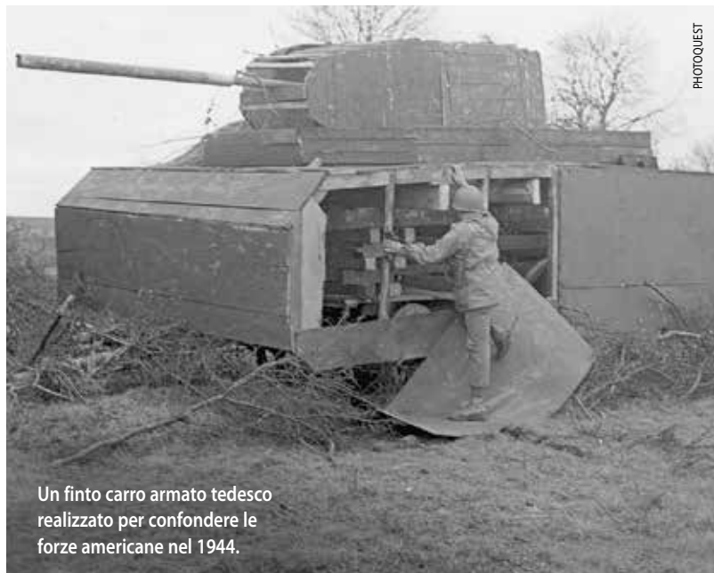
Un finto carro armato tedesco realizzato per confondere le forze americane nel 1944.

più sofisticati prodotti si scorgono crepe che tradiscono anche il più abile dei falsari. Nella "storia falsa" sono raccolti esempi clamorosi di doppi giochi per deviare il corso della lotta politica: dall'inverosimile lettera di Pausania spartano al re di Persia, ai discorsi che si leggono nelle Storie di Tucideide, alla lettera di Bruto fatta passare per falsa, al celebre "testamento" di Lenin, inghiottito per anni dalla macchina di partito.