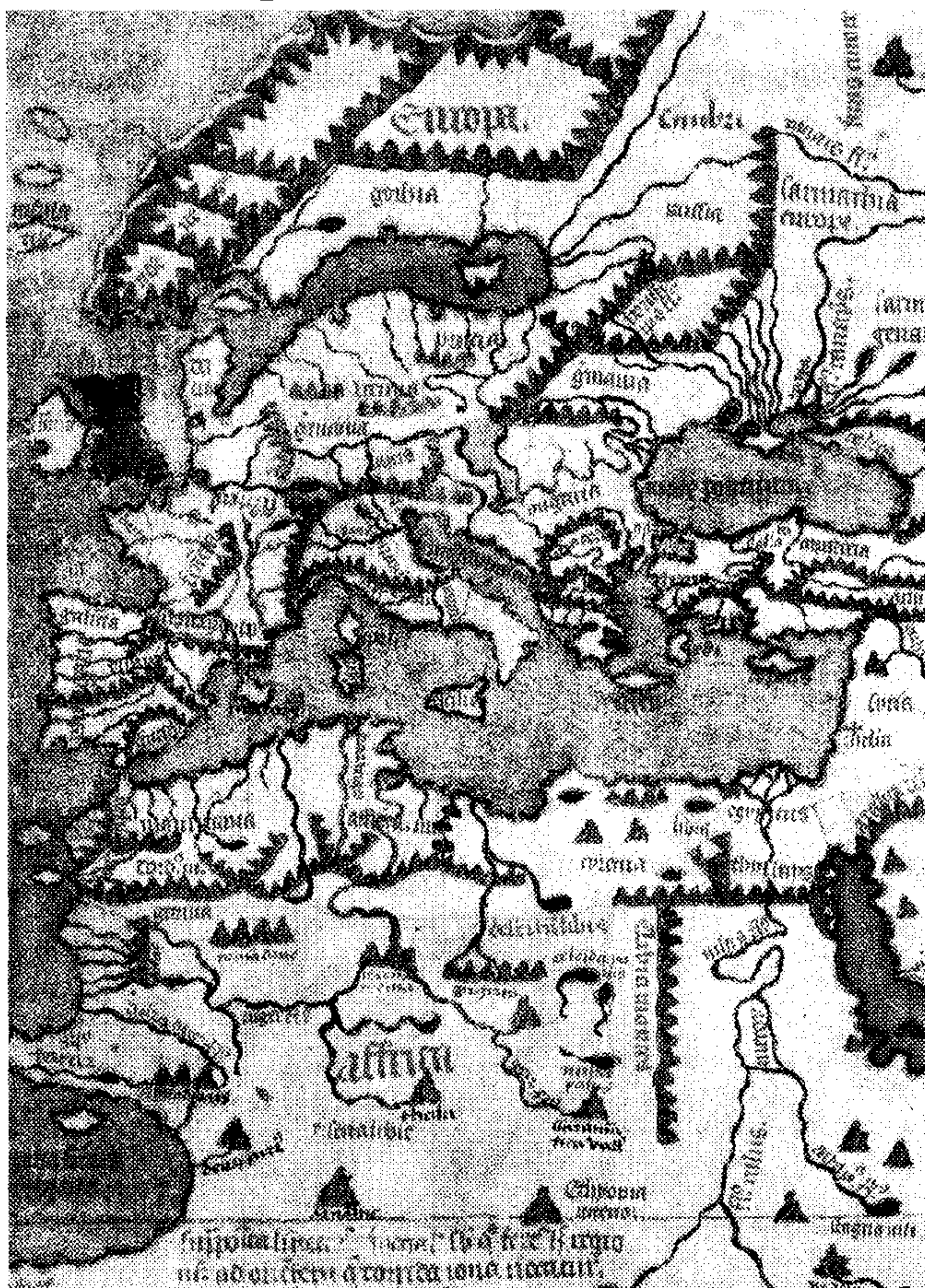
Un'antica cartina dei paesi che si affacciano sul Mediterraneo

Per rendere più esplicita la consanguineità delle religioni monoteiste, l'autrice spiega - quasi scusandosi della vulgata - che «l'Islam entra nella nostra cultura grazie a stoffe e tappeti, nella cucina con lo zucchero, nella nostra letteratura con lo scontro