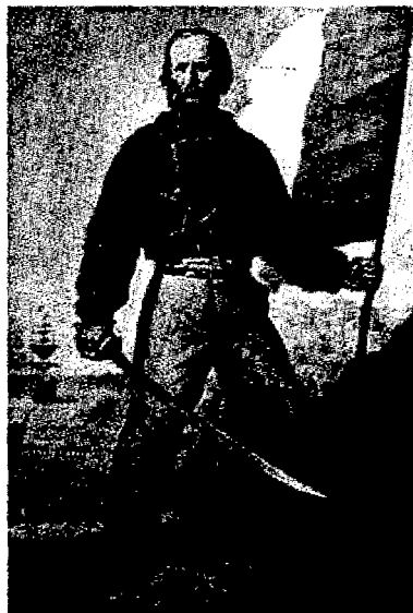
Protagonisti Giuseppe Garibaldi. In alto, Camillo Benso conte di Cavour.

5 maggio 1860 Centocinquant'anni fa Garibaldi e i Mille partirono da Quarto per unificare l'Italia