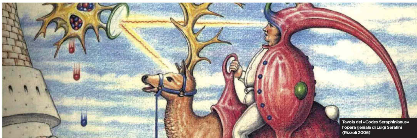
Tavola del «Codex Seraphinianus» l'opera geniale di Luigi Serafini (Rizzoli 2006)