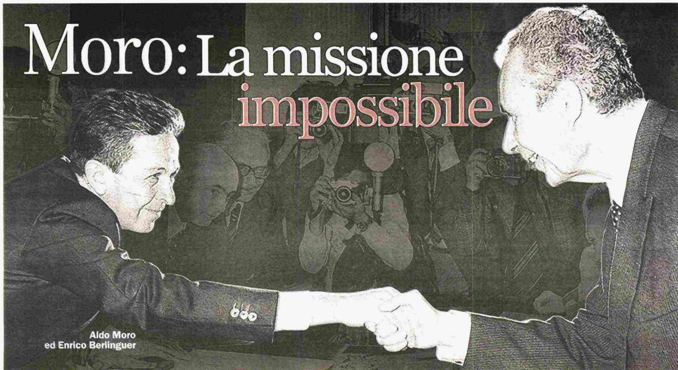
Aldo Moro ed Enrico Berlinguer